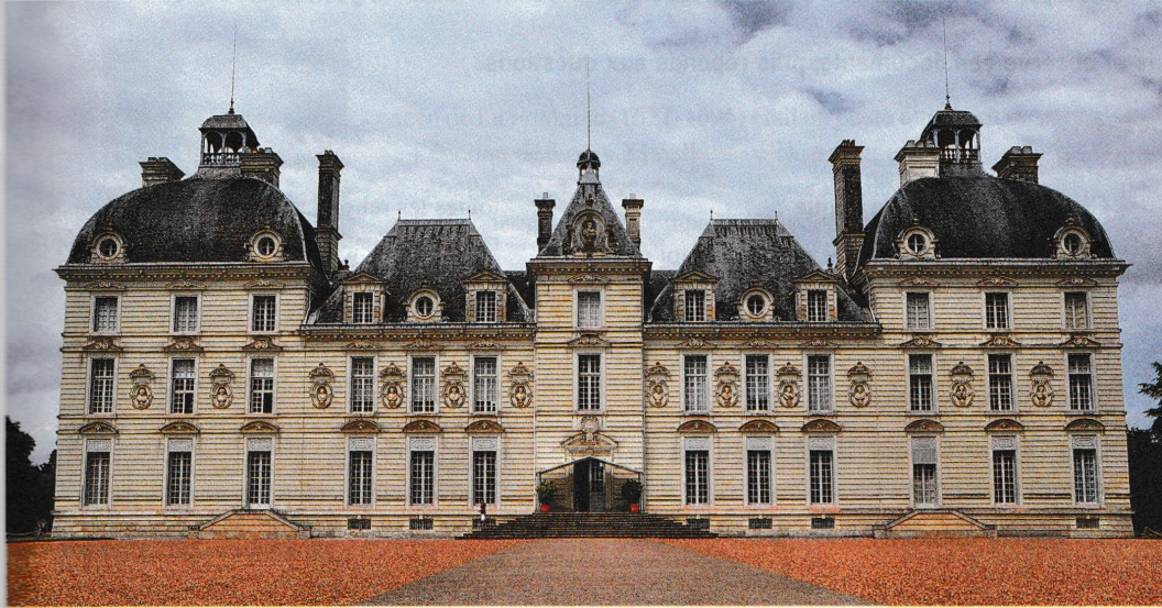
Photographie du château de Cheverny.

À 80 km de Chambord, le château de Cheverny (Loir-et-Cher) a été construit en suivant les mêmes règles de symétrie.